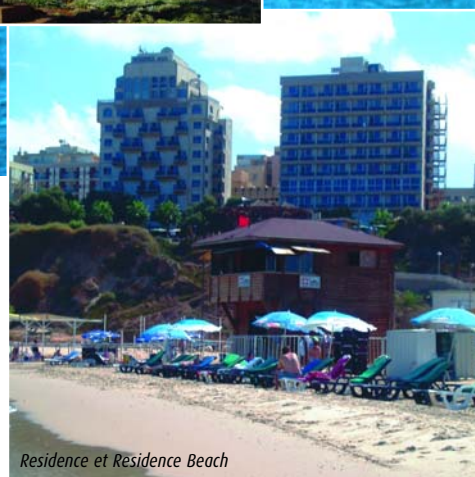
Residence et Residence Beach