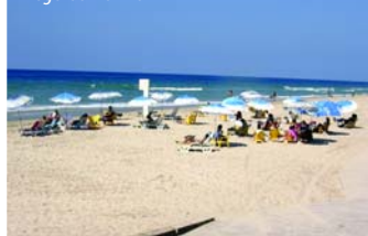
Plage de Herzlia

A votre disposition: restaurants, bar, boutiques, salon de coiffure, parking.